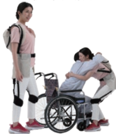
J-PAS fleary 移乗支援